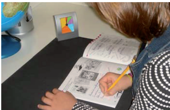
Model B in de praktijk

Er zijn diverse modellen verkrijgbaar voor verschillende toepassingen. Zo zijn er modellen voor klassikaal-/groepsgebruik, maar ook speciaal voor individueel gebruik en gebruik op de PC.